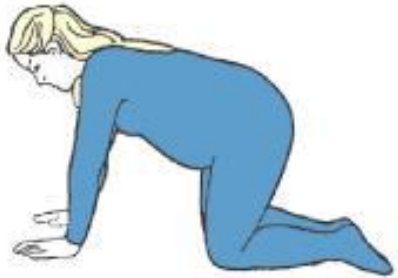
Hands and knees