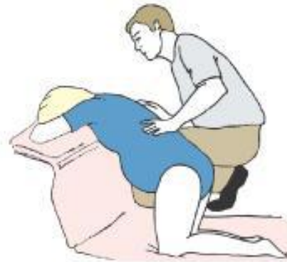
Kneeling and leaning forward with support